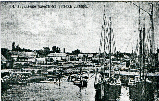
14. Управління роботи із установами Антура.

30 березня 1944 року відбулася визначна подія в історії України. Першостоліця Північного Причорномор'я було повернуто статус адміністративного центру великого територіального утворення – Херсонської області. Місто Херсон стало областним центром, відновило своє значення – Херсонської області, адміністративних і культурних традицій, започаткованих у період більш як столітнього існування Херсонської губернії.